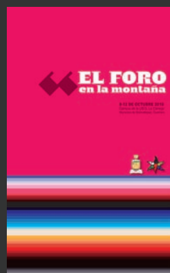
Claudia Quintanilla Villa