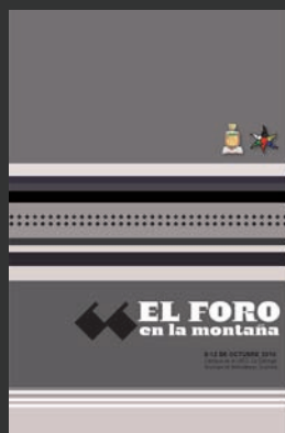
Claudia Quintanilla Villa