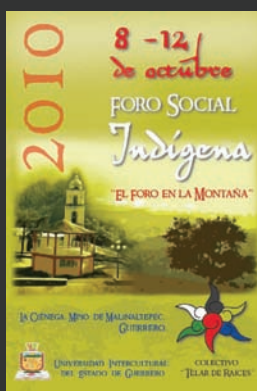
Estudio Gráfico Suula